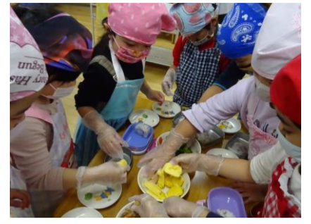
こすもす組『スイートポテト』